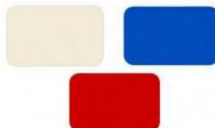
Krem, głęboki błękit, szkarłat