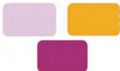
Fiolety i pomarańcz