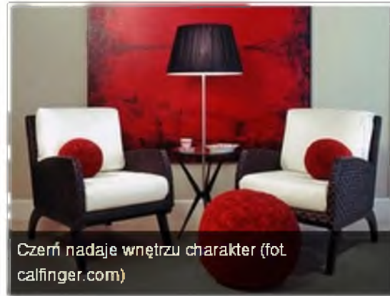
Czerń nadaje wnętrzu charakter

W nowoczesnych wnętrzach nie bójmy się czerni. Jest piękna, elegancka. Nadaje wnętrzu charakteru. Tym czego należy unikać, urządając wnętrze nowoczesne , są kolory ciepłe, pastelowe. Pamiętajmy, że we w takim wnętrzu podkreślamy proste linie mebli i architektury. Rezygnujemy z koronek, falban, frędzli. Można wprowadzać tapicerki geometryczne, bądź zwierzęce wzory. Poniżej proponujemy zestawienia kolorystyczne pasujące we wnętrzach nowoczesnych.