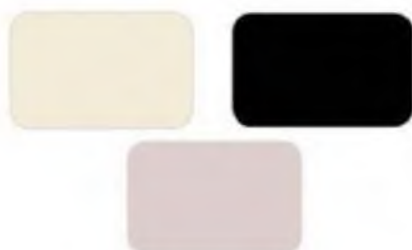
Złamane biele i czern